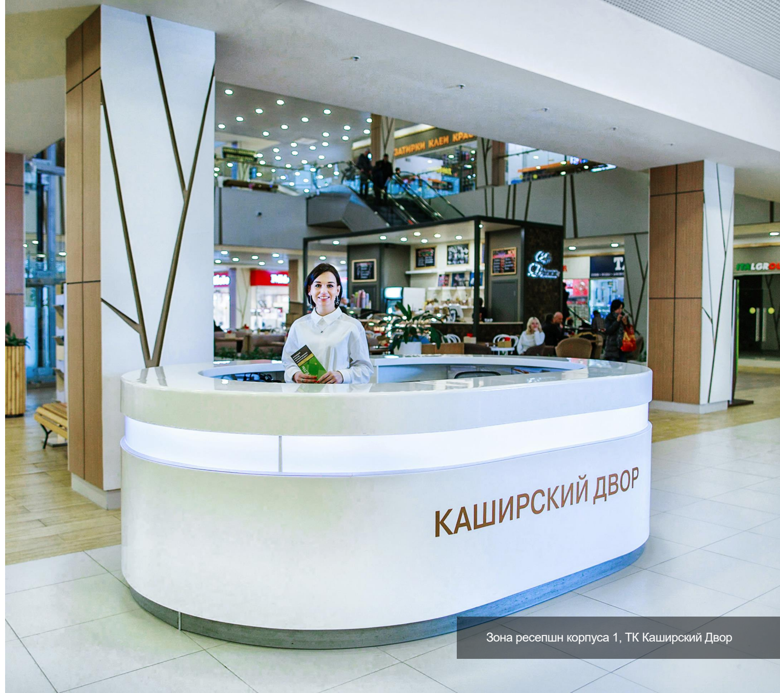
Зона ресепшн корпуса 1, ТК Каширский Двор

В специализированные DIY центры потребитель приезжает реже и, как правило, за разными категориями товаров. Ввиду этого, у покупателя отсутствует «любимый» маршрут. Поэтому в DIY комплексах большое внимание уделяется удобному зонированию и понятной навигации.