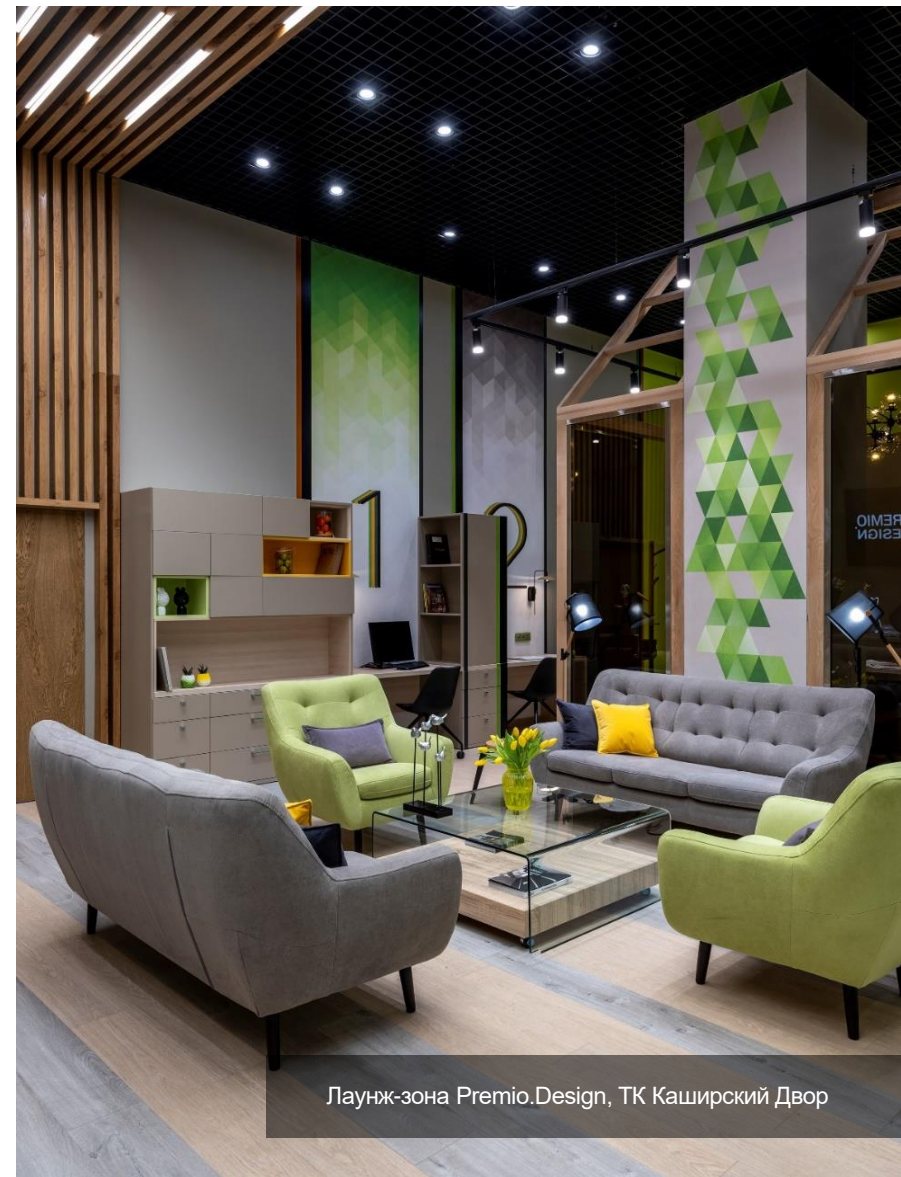
Лаунж-зона Premio.Design, ТК Каширский Двор