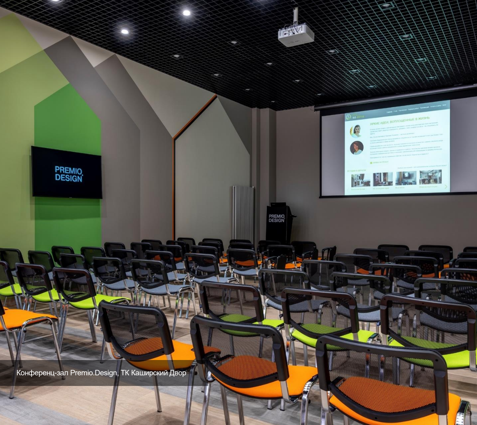
Конференц-зал Premio.Design, ТК Каширский Двор