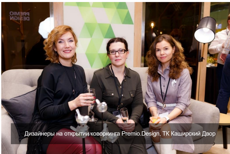
Дизайнеры на открытии коворкинга Premio.Design, ТК Каширский Двор